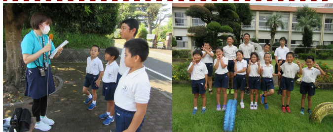
MBCラジオ取材の様子