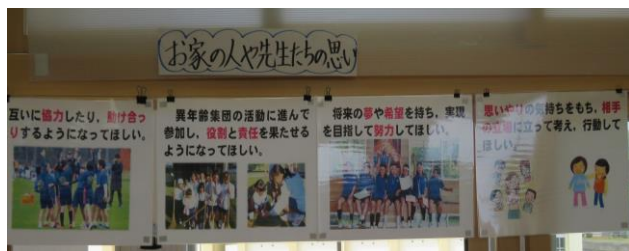
【写真②：学級活動(3)との関連】