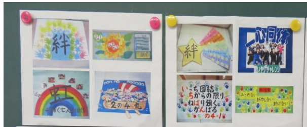
【写真③：他校の学級目標】