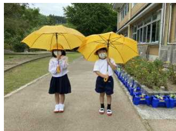
▲ 市社会福祉協議会から1年生全員に黄色い傘