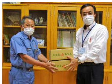
▲ 市茶業振興会知覧支部から「知覧茶」の新茶