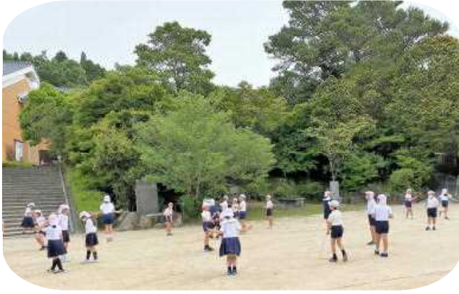
▲子供たちの元気な声が響いています

新型コロナウイルスの新規感染者数が減少傾向となり、8日と9日の登校日を経て、11日から学校が再開しました。マスクや換気など、感染防止対策が欠かせないものの、子供たちは久々の再会に喜びをはじけさせ、学び舎に活気があふれました。感染収束へ向け、学校が「日常」を取り戻し始めています。