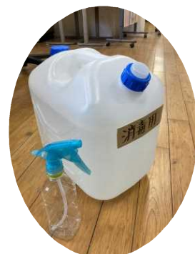
▲ 南さつま青年会議所と南薩東京社から消毒液(次亜塩素水)