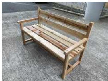
▲ 薩南工業高校建築科の生徒さんから長椅子5脚など

地域の皆様や薩南工業高校から学校で使ってくださいと、いろいろな物をいただきました。どれも皆様の温かい心遣いが感じられる物ばかりです。