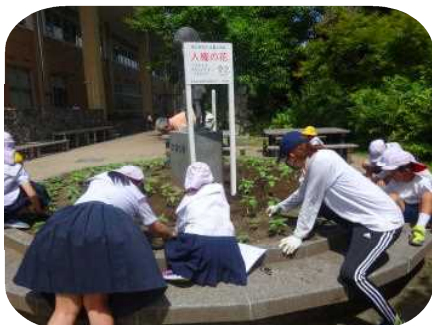
▲人権の花運動でひまわりの手入れ