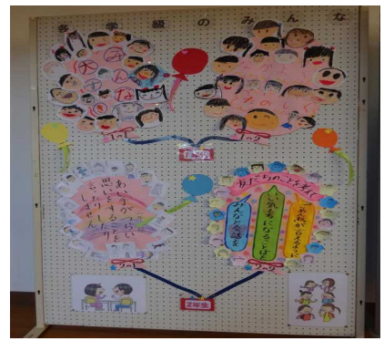
いじめ撲滅宣言(1・2年)

「いじめ」が絶対に許されない行為であることはもちろんですが、それだけでなく私たちの心の中にある「隠れた差別意識」にまで気づき、改められたらいいですね。