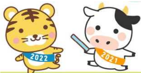
丑年から寅年へバトンタッチ

令和4年(2022年)の干支は壬寅(みずのえとら)です。「壬」は陽気を下に宿すという意味を持っており、「寅」は「蟻(ミミズ)に通じ、春の草木が生ずる」という意味があります。そのため「壬寅」は厳しい冬を越えて、芽吹き始め、新しい成長の礎となるイメージです。コロナ禍の閉塞感から脱却し、明るく元気な日常が帰ってくることを期待されます。