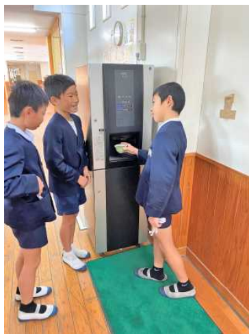
▲いつでもおいしいお茶が飲めます。

飲めるとても有り難いものです。知覧小には3台設置され、子供たちもとても喜んでます。日本一のお茶のまちにある学校だからこそ設置されたのです。他の市町村の学校からしたらなんとやらやましいことなのでしょう。学校に来られるお客さんもびっくりしています。そして何より、このお茶が本当においしいのです。これからも、感謝の気持ちでおいしいお茶をいただきたいと思います。