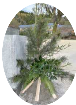
▲薪を3本置く独特の門松