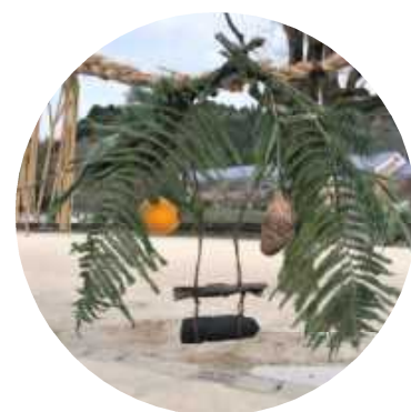
▲しめ縄に飾るのは ウラジロ、橙、炭、里芋、昆布